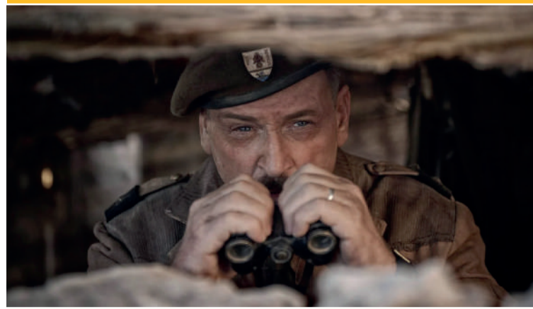
La Bataille de Gaule l'âge de fer

Place de l'Hôtel de Ville 36400 La Châtre